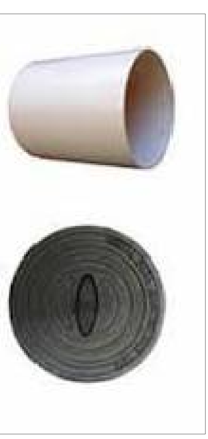
CAIXA DE INSPEÇÃO (DETALHE)