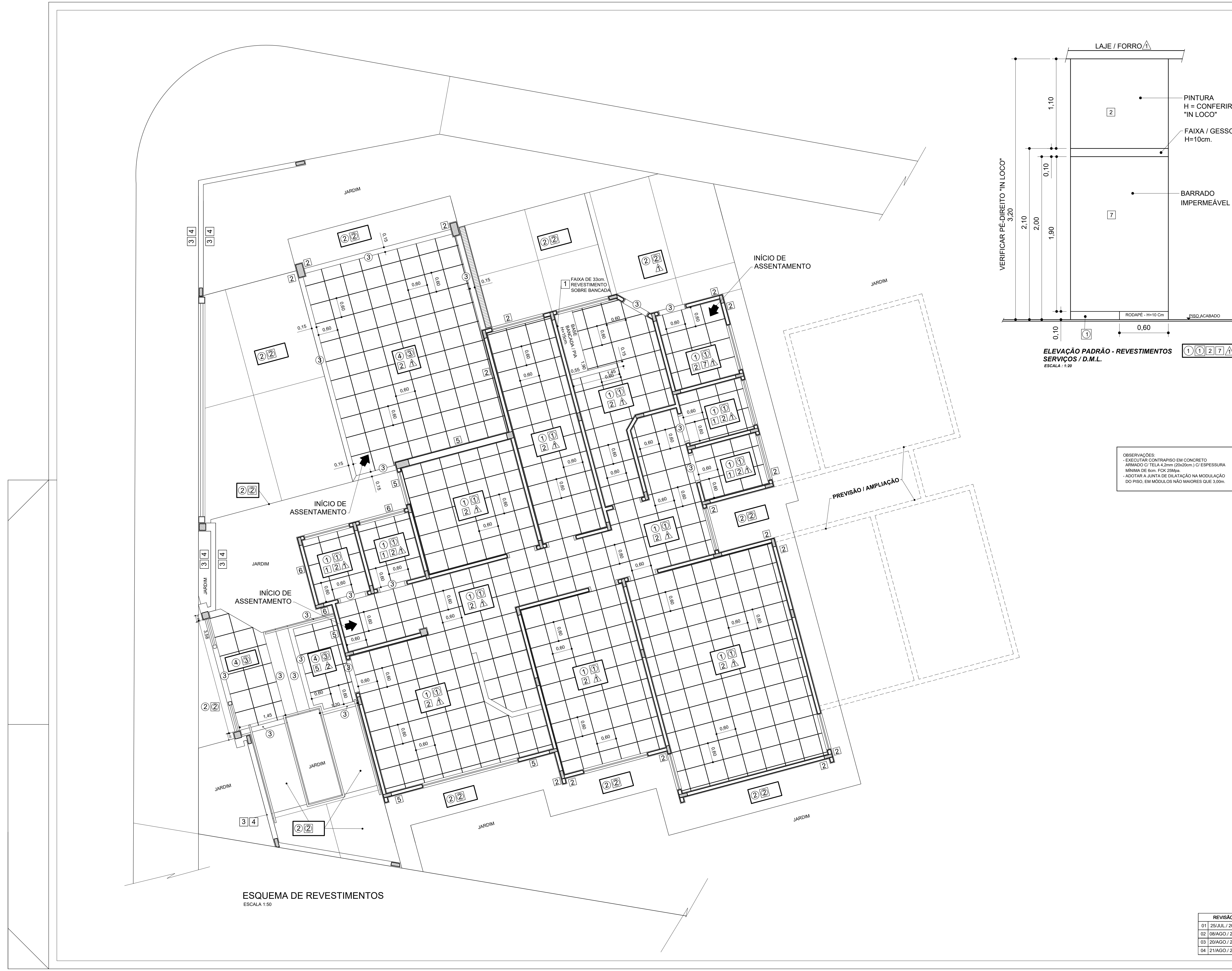
ESQUEMA DE REVESTIMENTOS ESCALA 1:50